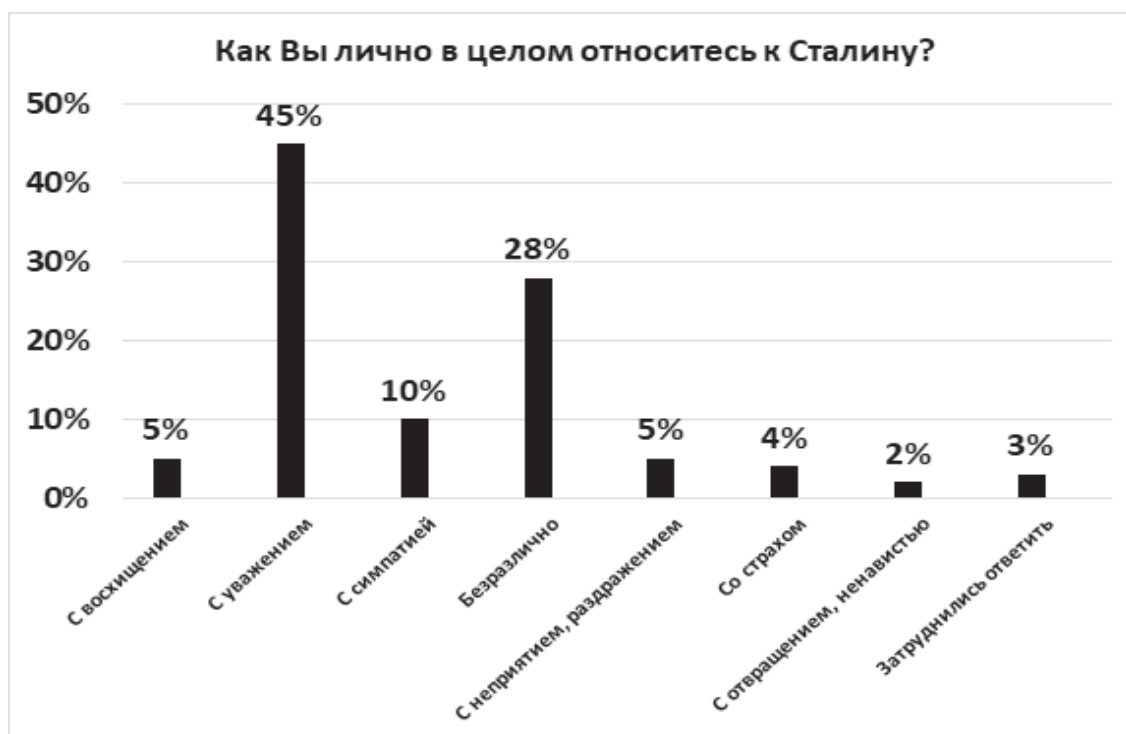
Рис. 1. Отношение к Сталину

Результаты опроса продемонстрировали явно положительное отношение к данному историческому персонажу. В той или иной форме его продемонстрировали 60% респондентов. Тогда как разные степени неприятия — лишь 11%.