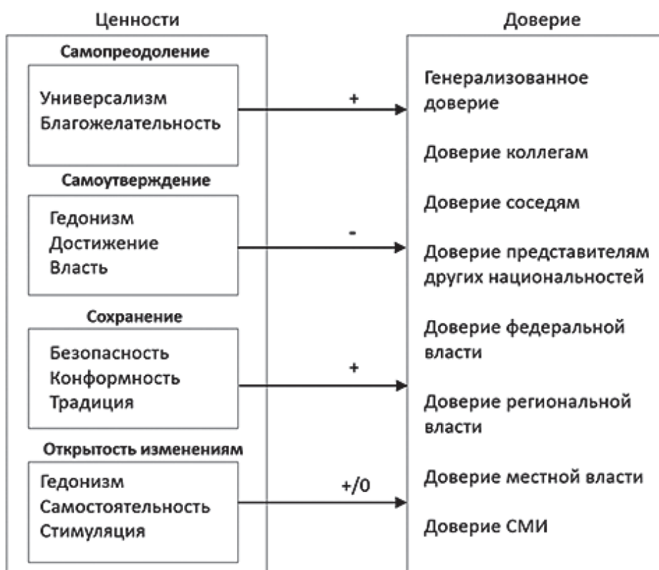
Рис. 1. Дизайн эмпирического исследования

Общая гипотеза исследования состоит в том, что ценности блока Самопреодоление (Универсализм и Благожелательность) позитивно связаны с различными видами доверия; соответственно, ценности блока Самоутверждение (Гедонизм, Власть) имеют противоположный эффект. Ценности блока Сохранение (Безопасность, Конформность) негативно связаны с различными видами доверия, а ценности блока Открытость изменениям (Самостоятельность, Стимуляция) либо позитивно связаны с доверием, либо вообще не имеют с ним взаимосвязей.