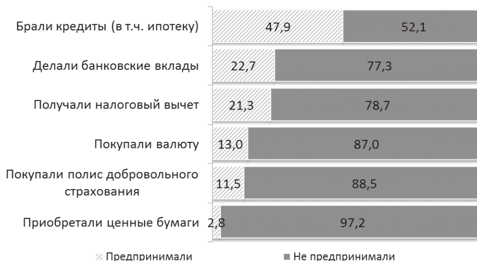
Рис. 1. Формы финансового поведения (в %)

Агрегировав формы финансового поведения молодых людей, можно рассчитать интегральный показатель финансовой активности. Полученные результаты предполагают следующее разделение опрошенных молодых людей: