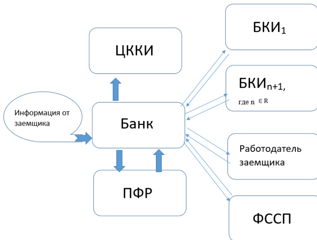
Рисунок 4. Действующая система обработки информации о заемщике-физическом лице.