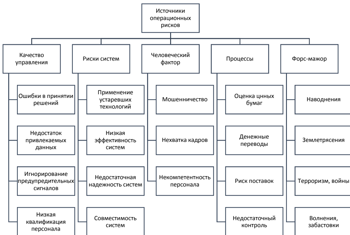
Рисунок 1. Источники возникновения операционного риска