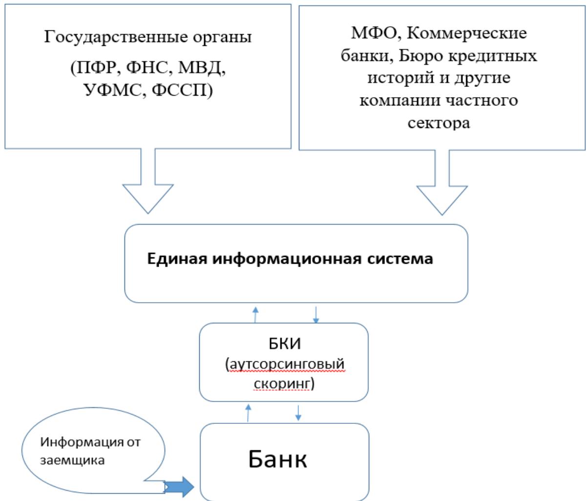
Рисунок 5. Усовершенствованная система обработки информации о заемщике-физическом лице.