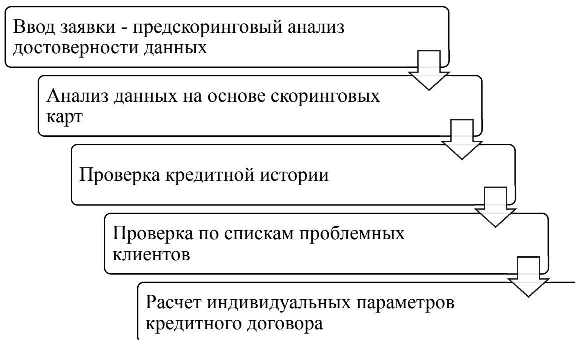
Рисунок 2. Этапы рассмотрения кредитной заявки с применением скоринговой модели оценки заемщика.

набранных баллов, и на основании средних математических переменных оценить риск дефолта по кредиту, т.е. построить прогнозную модель обслуживания кредита. Скоринг проводится в несколько этапов (рисунок 2).