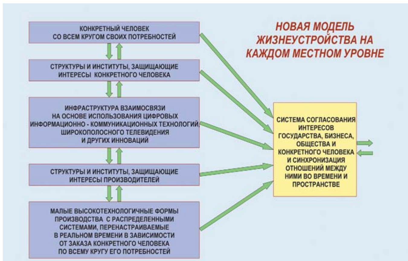
Рис. 2 Условная схема новой модели жизнеустройства на каждом местном уровне

шей десинхронизации во времени и в пространстве взаимосвязи различных технологий производства товаров и их потребления конкретным человеком, к еще большим диспропорциям во времени производства и обращения товаров и денег. Так, например, российский рынок Интернет-торговли становится привлекательным для иностранных компаний. Среди всех стран Европы, Азии и Африки России присуждено почетное 3-е место по привлекательности для развертывания деятельности иностранных онлайн-ритейлеров. Опубликованы даже практические рекомендации относительно того, как иностранным компаниям правильнее захватить российский рынок Интернет-торговли. А в условиях, когда российские потребители увидели, что им выгоднее делать покупки в иностранных интернет-магазинах, чем в российских, огромная денежная масса, проплаченная за эти товары, уходит за рубеж, а не в собственное производство и не в собственный бюджет. Тем более что Россия улучшила позицию в ежегодном рейтинге развития информационных технологий, который рассчитывают эксперты Всемирного экономического форума. В рейтинге за 2011–2012 го-