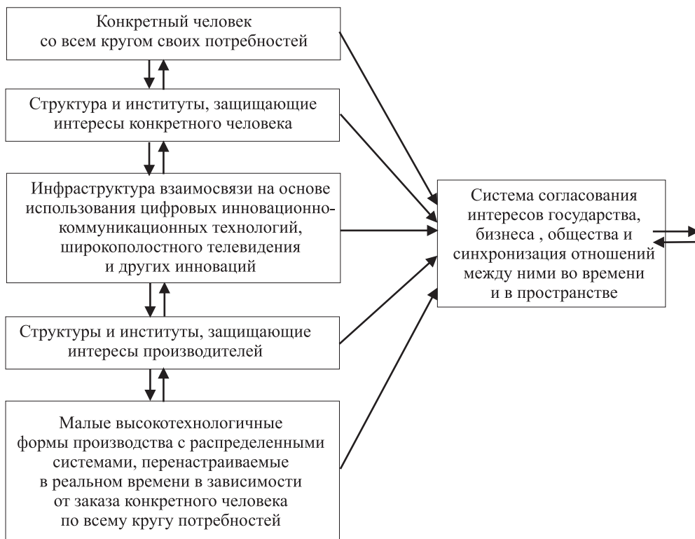
Рис. 2. Новая модель жизнеустройства на каждом местном уровне

Гармонизация человеческих отношений на каждом местном уровне через механизм согласования в реальном времени интересов всех