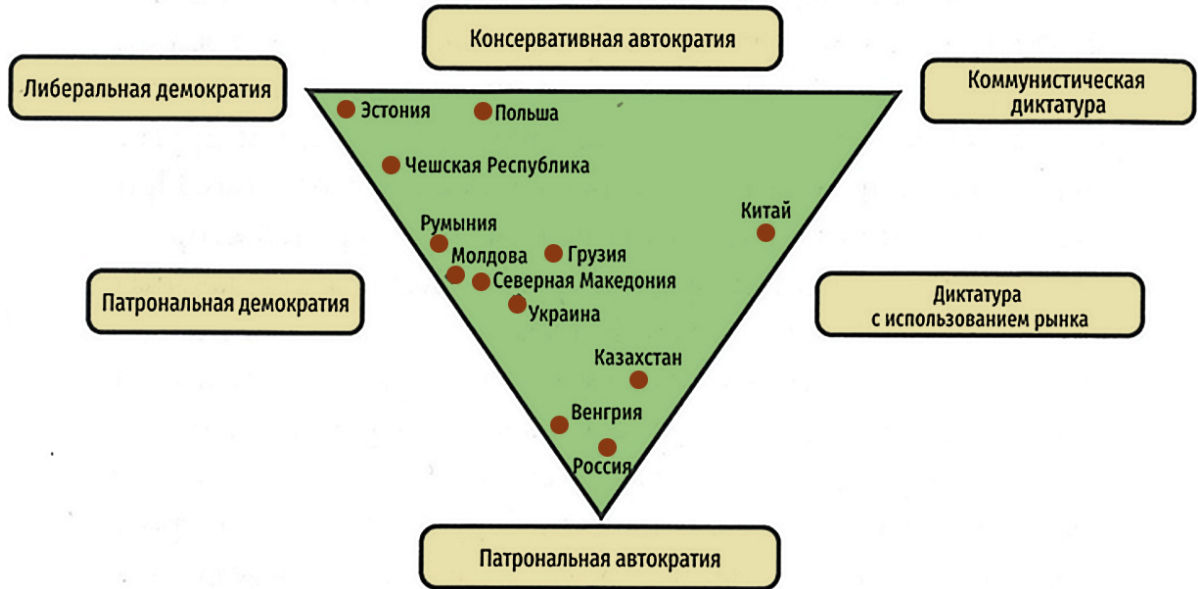
Рис. 2. Концептуальное пространство постсоциалистических режимов с 6 идеальными типами и 12 примерами расположения в нём стран (по состоянию на 2019 г.)

разных патрон-клиентских сетей, в которой значительную роль играют неформальные институты (сторона треугольника между патрональной автократией и либеральной демократией); диктатуру с использованием рынка (сторона треугольника между вершинами коммунистической диктатуры и патрональной автократии с комбинацией формальных и неформальных институтов) [Мадьяр, Мадлович, 2022. Т. 2. С. 545–554].