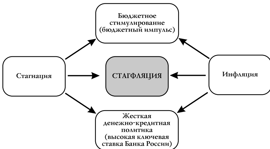
Рис. 2. Стагфляция — самовоспроизводящийся процесс (рамочная схема)

Простая (рамочная) схема воспроизводства стагфляции (рис. 2) заключается в следующем. В целях стимулирования экономического роста и недопущения стагнации проводится политика бюджетного стимулирования экономики (бюджетный импульс). Это порождает высокую инфляцию, для борьбы с которой реализуется жесткая денежно-кредитная политика (повышается ключевая ставка Банка России). Результат — дестимулирование экономики, ее стагнация. Получается замкнутый круг: бюджетное стимулирование (бюджетный импульс) — инфляция — жесткая денежно-кредитная