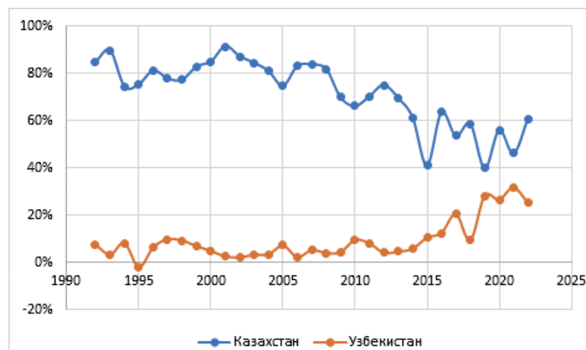
Рис. 2. Доля Казахстана и Узбекистана в прямых иностранных инвестициях в Центральной Азии.

Для начала обратим внимание на экстенсивные факторы экономического роста. Одним из ключевых инструментов увеличения инвестиций является интеграция в мировые капитальные рынки. Однако анализ данных UNCTAD по прямым иностранным инвестициям (FDI) указывает на снижение интереса иностранных инвесторов к Казахстану, особенно по сравнению с более благоприятными периодами, которые к тому же далеки во времени. Конкретнее, в 2022 г. объём FDI составил 6,1 млрд долл. США, что более чем в два раза меньше пикового значения в 14,3 млрд долл., достигнутого ещё в 2008 г. 27 . Стоит отметить, что после 2016 г. FDI не поднимались даже до уровня, достигающего лишь половину от этого пикового показателя (рис.2).