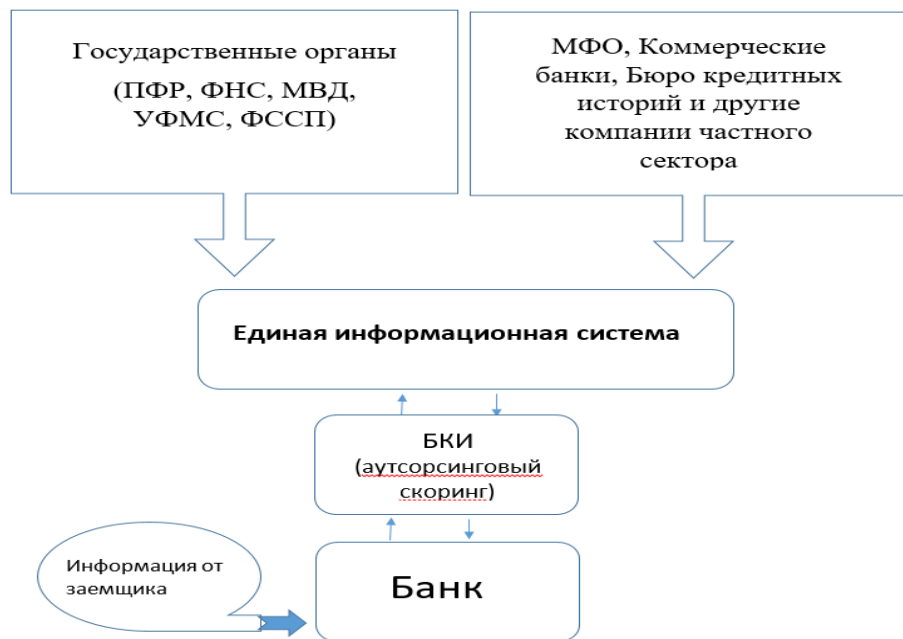
Рисунок 2. Усовершенствованная система обработки информации о заемщике-физическом лице