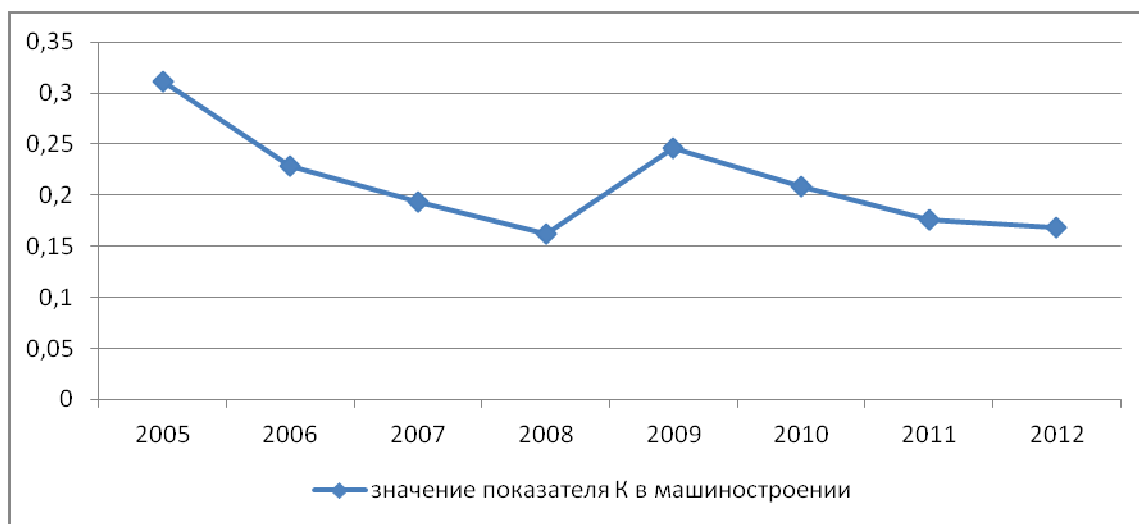
Рисунок 1 - Динамика изменения коэффициента структурной независимости для машиностроения

Приведем данные по производительности к уровню цен 2005 года. Рассчитанный коэффициент корреляции между производительностью труда и показателем структурной независимости оказывается равным -0,71 , знак минус показывает, что движение показателей происходило в разных направлениях - показатель снижался, а производительность труда росла; а сама величина коэффициента корреляции показывает на наличие умеренной связи между изучаемыми величинами.