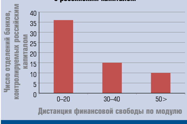
Рис. 2. Дистанция показателей финансовой свободы России и стран функционирования банков с российским капиталом

Преобладающее число отделений отечественных банков расположено в странах с сопоставимым с РФ уровнем финансовой свободы (где разница показателя финансовой свободы не составляет более 20 пунктов). Таким образом, можно предположить, что вероятность выхода банков из России в страны с сопоставимым уровнем финансовой свободы выше.