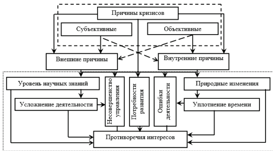
Рис. 2. Причины возникновения процессов нестабильности в развитии мировой экономики

крупных корпораций, нерациональная инновационная и инвестиционная политика, недостатки организации управления производства), и субъективными факторами (ошибки в управлении на различных уровнях).