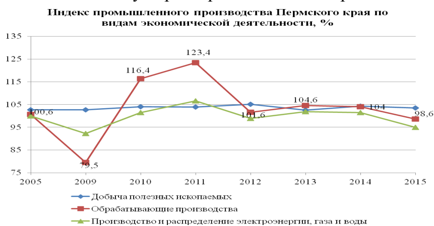
Рисунок 2 – Динамика промышленного производства по секторам обработки Пермского края, 2005-2015 гг.

Если с 2000 по 2010 годы изменялась структура инвестиций, осуществляемых за счёт собственных и привлечённых средств в пользу привлечённых ресурсов (улучшались условия кредитования), то в 2014-2015 гг. эта структура опять начала ухудшаться, то есть, доля собственных средств опять существенно возросла, привлечённых – снизилась [3]. Вместе с тем, наилучшее соотношение было достигнуто в 2010 и в 2012 году - 54,5% - собственные средства, 45,5% - привлечённые ресурсы. Сегодня это соотношение составляет 73,8% собственные и 26,2% - привлечённые средства. Изменение этой структуры, видимо, не является предметом задач внутренней региональной политики, скорее всего, требуется изменение макроэкономических условий инвестирования в масштабе страны, хотя отдельные возможности для изменения имеются и у региона, но смогут ли они приобрести изменяющий систему характер – большой вопрос.