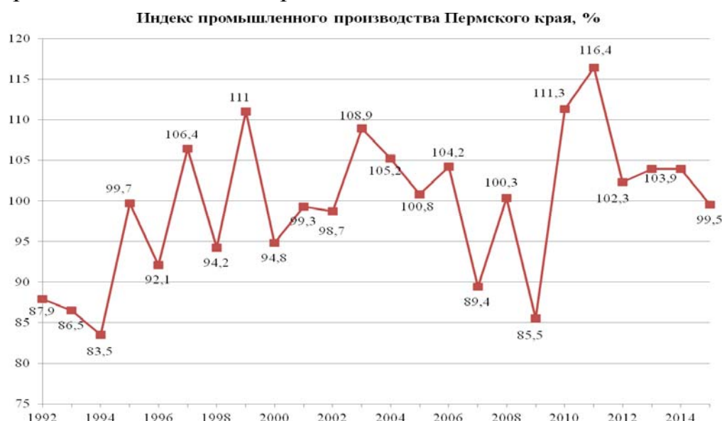
Рисунок 1 – Динамика промышленного производства Пермского края, 1992-2014 гг.

С 2005 по 2014 гг. структура ВРП Пермского края претерпела всё-таки существенные изменения – доля ведущих секторов ощутимо изменилась: обрабатывающий сектор с 29 до 31%, добыча полезных ископаемых в структуре ВРП сократилась с 16 до 15%, строительство с 3 до 4%, государственное управление с 3 до 5%. [2-4]. Валовой региональный продукт на душу населения возрастал, причём валовая прибыль устойчиво доминировала в его структуре по доходу. Вместе с тем, динамика индекса промышленного производства (см рисунок 1), демонстрирует крайне не устойчивый характер его развития, при том, в промышленном регионе, имеющем основательные традиции развития индустрии, включая высокие технологии и оборонное производство, можно было бы наблюдать более стабильное развития базовых секторов.