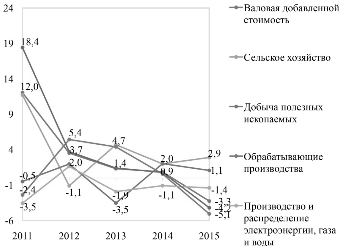
Рис. 4. Темп роста валовой добавленной стоимости по некоторым секторам РФ, 2011-2015*

*Источник: http://www.gks.ru/free_doc/new_site/vvp/vvp-god/tab11.htm