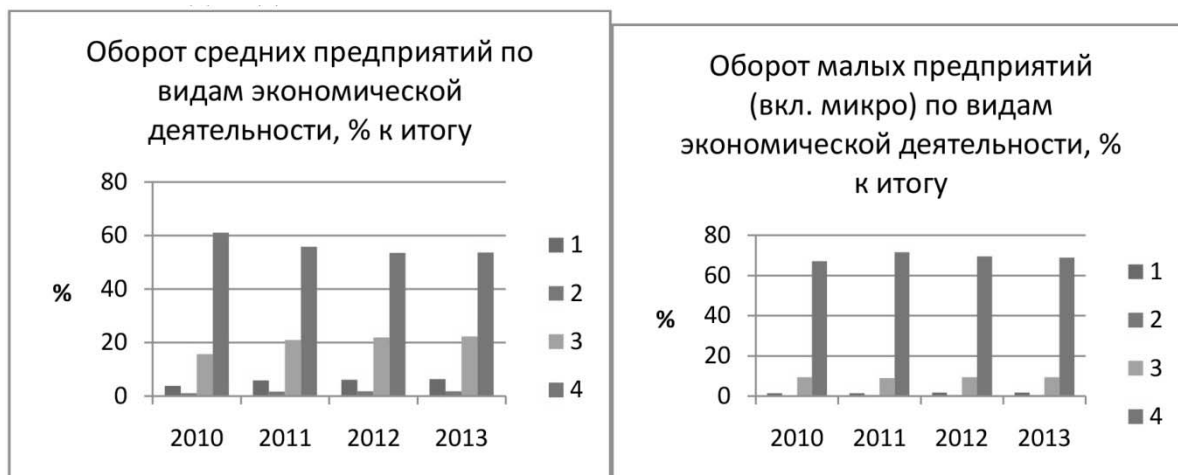
Рис. 1. Оборот средних (слева) и малых (микро) предприятий по видам деятельности*